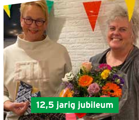
12,5 jarig jubileum