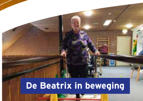
De Beatrix in beweging