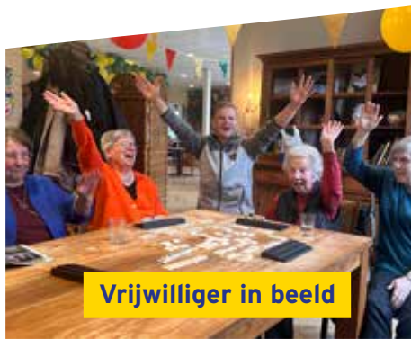
Vrijwilliger in beeld