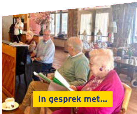
In gesprek met...