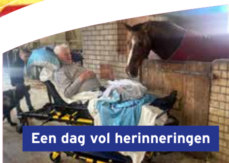
Een dag vol herinneringen